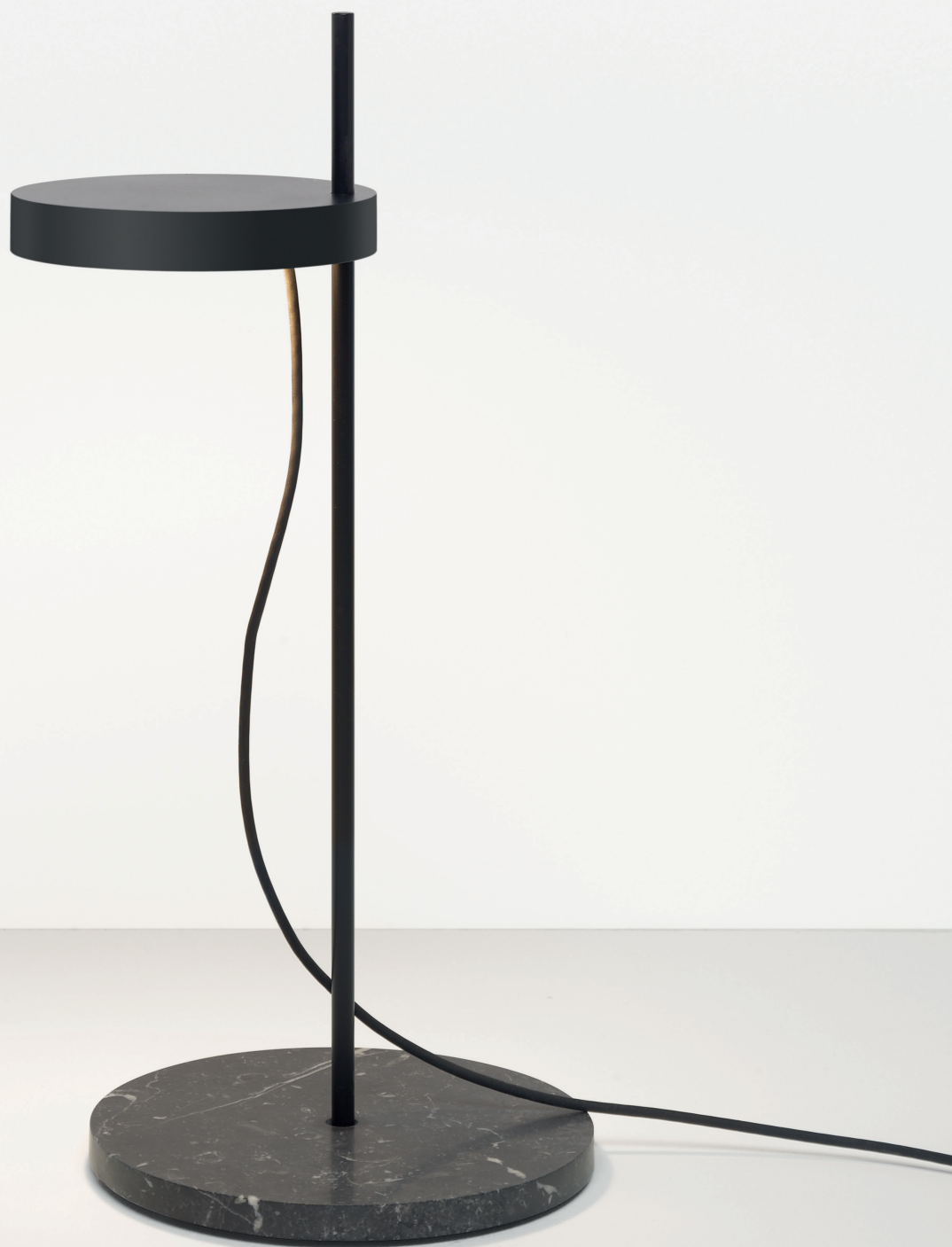
LT06 PALO TISCHLEUCHE / TABLE LIGHT ALUMINIUM, STAHL, TIEFSCHWARZ PULVERBESCHICHTET / ALUMINIUM, STEEL, JET BLACK POWDER-COATED MARMOR, NERO MARQUINA / MARBLE, NERO MARQUINA