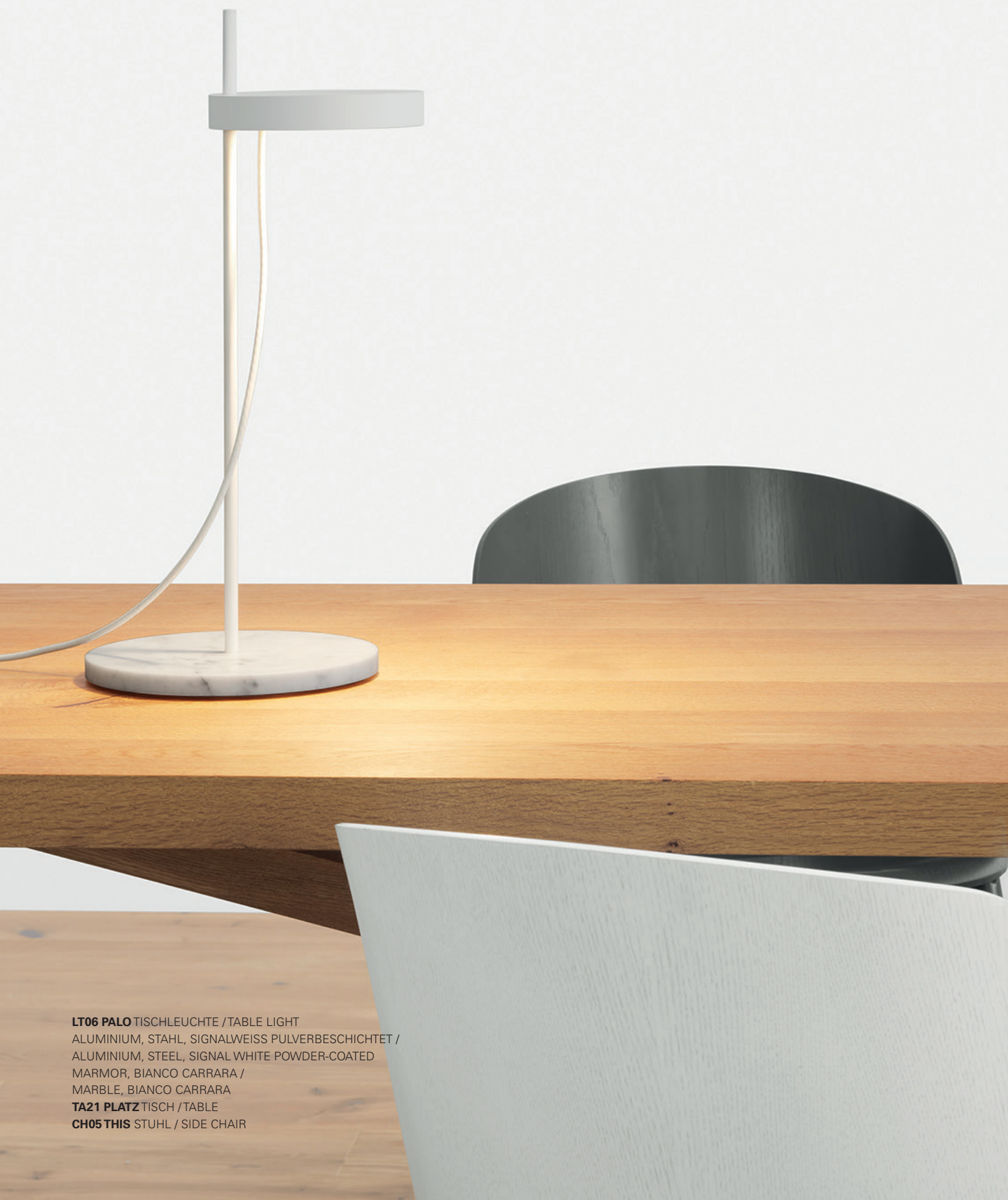
LT06 PALO TISCHLEUCHE / TABLE LIGHT ALUMINIUM, STAHL, SIGNALWEISS PULVERBESCHICHTET / ALUMINIUM, STEEL, SIGNAL WHITE POWDER-COATED MARMOR, BIANCO CARRARA / MARBLE, BIANCO CARRARA TA21 PLATZ TISCH / TABLE CH05 THIS STUHL / SIDE CHAIR