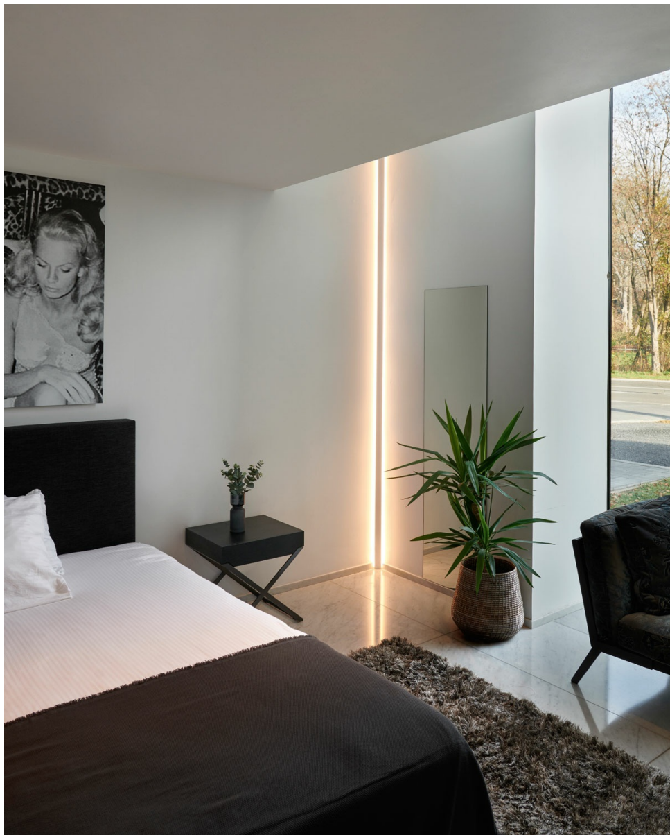
Imagen del proyecto